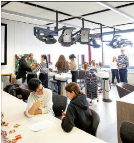
Neben vielen technischen Berufen kann man an der Willi-Burth-Schule auch eine Ausbildung als Friseur/-in machen.