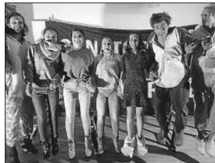
Schülerinnen und Schauspieler nach der Aufführung