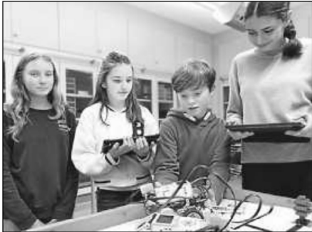
Robotics zum Ausprobieren

aus, dass man bei ihrem Anblick kurz erschrak, bevor man ein Schmunzeln nicht unterdrücken konnte. Also erst einmal am Buffet der Klasse 7c einen leckeren Kaffee samt Kuchen schmecken lassen und dann weiter durch die Ausstellungen bummeln.