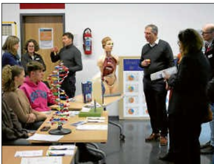
Neben einer klassischen dualen Berufsausbildung, bei der die Schüler/Azubis jeweils die Hälfte ihrer Ausbildungszeit im Betrieb und in der Berufsschule verbringen, gibt es an den Bad Saulgauer Berufsschulen auch die Möglichkeit, eine (Fach-) Hochschulreife zu erlangen, beispielsweise über den Besuch eines Berufskollegs.