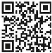
QR-Code: Welt der Igel e.V.

Zu beachten ist außerdem, dass nicht jeder Igel im Herbst automatisch unsere Hilfe braucht: So ist eher kontraproduktiv, einen Igel ins Haus bzw. in den Keller zu holen, denn Gefangenschaft löst bei den kleinen Tieren starken Stress aus. Igel sind Insektenfresser und Laubhäufen reichen oftmals schon aus, da sich dort viele Insekten ansiedeln können. Wenn Sie zusätzlich helfen wollen, bietet sich beispielsweise ungewürztes, gut durchgebratenes Rinderhackfleisch oder Katzenfutter mit hohem Fleischanteil an. Weitere Informationen dazu befinden sich in der neuesten Auflage der städtischen Gartenfibel „natürlich gut gestaltet“, die Anfang Oktober erscheint, oder auf der Homepage des Vereins „Welt der Igel e.V.“ Zudem wird im Laufe des Oktobers im NaturThemenPark im Heckenschaugarten gemeinsam mit dem Verein ein „Igelgarten“ mit vielen Infos zu den beliebten Stachelhäutern gebaut.