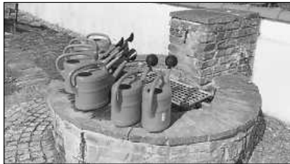
7 Gießkannen auf einen Streich

Sehr überrascht wurden Ortsvorsteher Eisele und die Friedhofsverwaltung am Sonntag beim Gang zum örtlichen Friedhof, standen dort doch 7 neue, himmelblaue Gießkannen am Brunnen. Ob diese im Zusammenhang mit dem vergangenen Bericht über fehlende Ausgießer oder ob diese vom „Himmel“ geschickt wurden, erschließt sich Ortsvorsteher Eisele nicht. Die Friedhofsverwaltung bedankt sich sehr herzlich für diese ungewöhnliche und unentgeltliche Zuwendung bei dem/der anonymen Spender/-in.