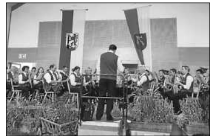
Von Anfang an beim Dorffest dabei: die Stadtmusik Bad Saulgau

Allen, die sich in irgendeiner Form für das traditionelle Dorffest einsetzten, beim Auf- und Abbau, in der Küche bei der Essensausgabe, dem Richten der Salate, an der Fritteuse, beim Spülen, beim Kuchenverkauf und der Getränkeausgabe, beim Dinnete-Backen, an der Hüpfburg oder wo auch immer, sei für ihren Einsatz für die Dorfgemeinschaft sehr herzlich gedankt. Ohne sie wäre so ein Fest unmöglich zu stemmen und es verlore auch seinen ganz eigenen Charakter. Deshalb sei die Hoffnung geäußert, dass sich auch im kommenden Jahr genügend Helferinnen und Helfer finden, diese schöne, über 40-jährige Tradition im und um das Dorfgemeinschaftshaus in Bogenweiler fortzusetzen.