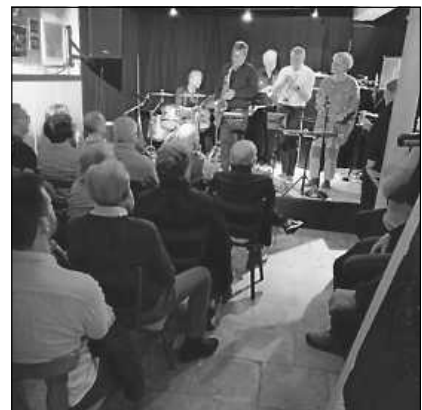
Konzert im Jazzkeller

Was genau macht eine Jam Session aus? Musiker treffen sich und spielen (mehr oder weniger) spontan zusammen. Manchmal ist ein Notenrepertoire zur Auswahl von Songs vorhanden. Eines ist bei aller Vielfalt gleich: der Grundgedanke, beim lockeren Zusammentreffen und gemeinsamen Musizieren ganz ungezwungen Spaß miteinander zu haben. Vielleicht hat der ein oder andere schon einmal bei einer Jam Session zugehört und der Spaß, den die Musiker untereinander hatten, die Spontanität und Lockerheit hat sofort angesteckt? Die Grenze zwischen Bühne und Publikum wird dabei verwischt. Die Mitspielenden wechseln sich ab. Wer nicht mehr auf die Bühne passt, spielt einfach vom Publikum aus mit. Immer wieder kommen weitere Gäste mit auffällig geformten Taschen herein, bei denen die Spannung steigt, welches Instrument hier ausgepackt wird. Und wer nun davon träumt, auch einmal bei einer Jam Session mitzuspielen, der sollte das definitiv tun. Eine Jam Session ist lustig, inspirierend und lehrreich zugleich.