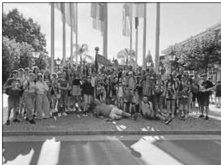
Gruppenbild aller Teilnehmer

Kinder und Jugendliche der Traditionsvereine aus Heimat- und Trachtenverein, Jugendspielmannszug der Bürgerwache und der Dorausunft unternehmen zu Beginn der Sommerferien einen gemeinsamen Ausflug in den Europapark nach Rust. Früh am Morgen ging es mit den Betreuer/-innen im Reisebus los, um zur Parköffnung am Zielort zu sein. Die Kinder und Jugendlichen konnten in kleinen Gruppen selbst den Freizeitpark erkunden und so individuell ihre Interessen - ob Showprogramm, traditionelle Fahrgeschäfte oder auch Vesperpausen - festlegen. Bei den tropischen Temperaturen standen bei vielen aber die rasanten Wasserfahrten und unzähligen Achterbahnen ganz oben auf der Liste. Sichtlich erschöpft und mit einem Lächeln im Gesicht aller Beteiligten ging es am Abend wieder im Bus zurück nach Hause.