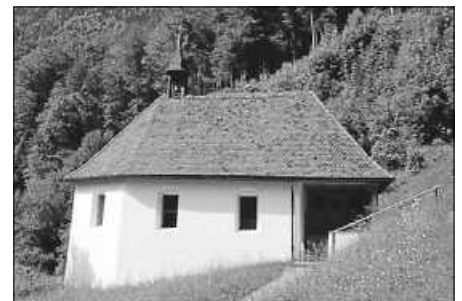
Oberer Ranftkapelle Flüeli, in: Pfarrbriefservice.de

Der Portiunkula-Ablass geht auf den Heiligen Franziskus selbst zurück. Beim Gebet in seiner kleinen Kirche sei ein Lichtstrahl erschienen, auf dem Altar habe er Christus und zu dessen Rechten die Gottesmutter Maria und Engel gesehen. Christus habe ihm aufgetragen, beim Papst um einen vollständigen Ablass für diejenigen zu bitten, die in die Kapelle als reuige Sünder kämen. Der damalige Papst Honorius III. gab der Bitte des Heiligen statt, allerdings verknüpfte er den Ablass mit einem engen Zeitfenster: Nur am 2. August sollte dieser Ablass zu erhalten sein, unter der Bedingung, dass der Sünder ehrliche Reue zeige, gebeichtet habe, das Vaterunser und das Credo spreche, ein Gebet in der Intention des Papstes sage sowie einer Heiligen Messe beiwohne. Der Ablass kann am 2. August (oder am ersten Sonntag im August) ab 12:00 Uhr des Vortages bis 0:00 Uhr des betreffenden Tages weltweit in den Kirchen der franziskanischen Ordensgemeinschaften aber auch in allen Pfarrkirchen oder Filialkirchen, die einen eigenen Sprengel haben, gewonnen werden.