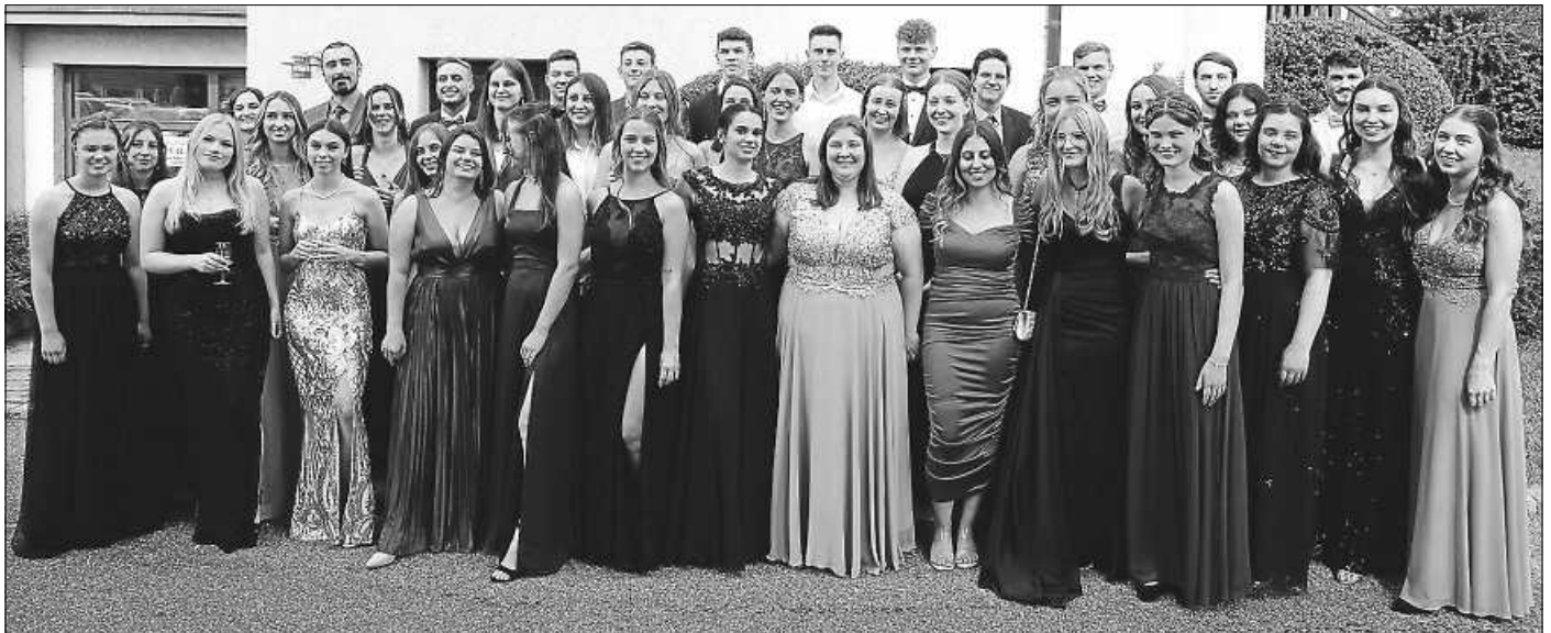
Abi 2022 an der Helene-Weber-Schule