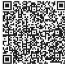
Hier geht es direkt zum Ticketverkauf!

die Planung des großen Flohmarktes mit integriertem Krämermarkt für den Samstag, 17.9.2022 . Dann kann nochmals in diesem Jahr in der Zeit von 8:00 bis 16:00 Uhr nach Herzenslust in der gesamten Innenstadt unter Einhaltung der dann geltenden Corona-Regeln gekruschelt und gefeilscht werden. Es werden wieder rund 450 Flohmarktstände, zusätzlich einige Krämermarkthändler und Imbissstände und Händler mit Neuware erwartet. Haben Sie Interesse zu verkaufen? Sollten Sie ein Flohmarkthändler sein, hat sich die organisatorische Abwicklung seit diesem Jahr deutlich vereinfacht.