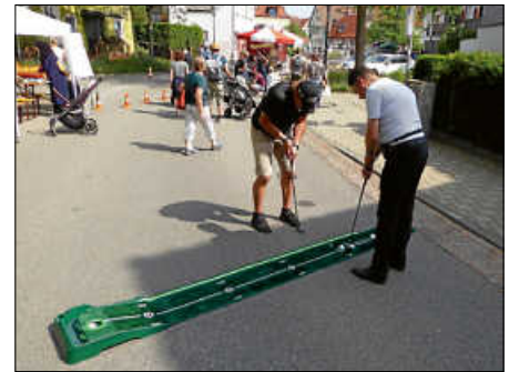
Gut angenommen wurde auch die Miniatur-Golfbahn des Golfclubs Bad Saulgau.