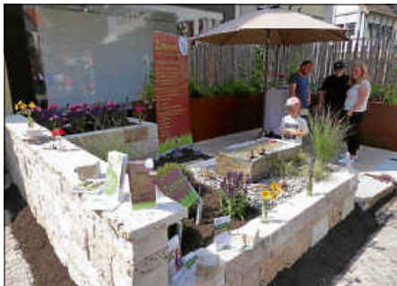
Ebenso attraktiv stellte sich der Garten der Firma Zimmel Garten und Landschaftsbau dar.