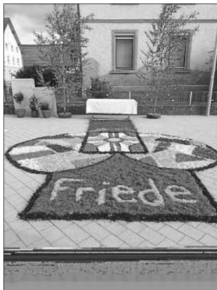
Blumentepich vor dem Pfarrhaus in Bilstern

„Vergelts Gott!“ allen Firmlingen für ihr Firmopfer zugunsten der Diaspora-Kinderhilfe des Bonifatiuswerks.