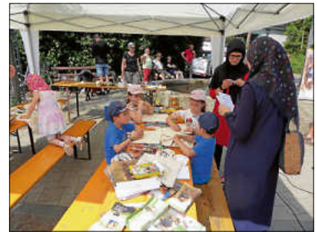
Beim Schäferhundeverein Bad Saulgau wurden Stofftaschen bemalt.