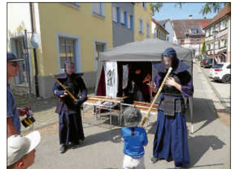
„Unheimlich“ ging's beim Kendo-Verein zu.