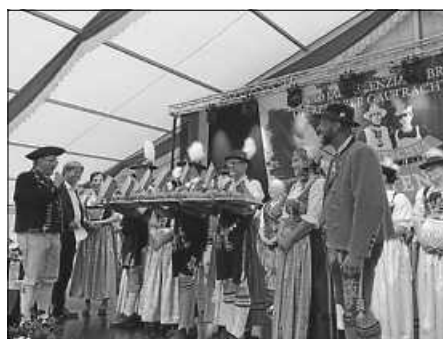
Übergabe an den Ausrichter 2024