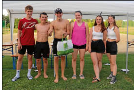
Die Siegermannschaft des Turniers „Beach Boys“.