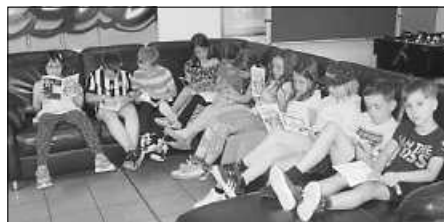
Kinder informieren sich über die Sommerferienspaß-Angebote 2022

In der dritten und vierten Sommerferienwoche, d.h. vom 15. bis 26. August 2022, können die persönlichen Anmeldungen während der Öffnungszeiten des Bürgerbüros erfolgen.