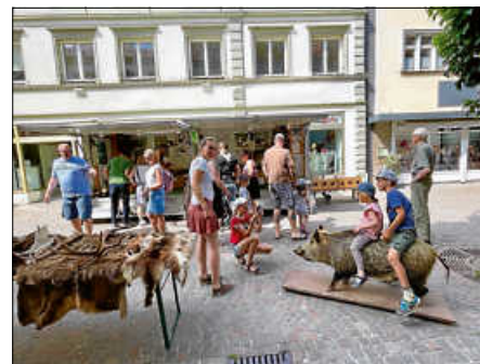
Die Jägervereinigungen Altkreis Saulgau und Sigmaringen e.V. hatten viel Anschauungsmaterial dabei. Besonders attraktiv waren neben der Jagdhundevorführung die ausgestopften Waldtiere.