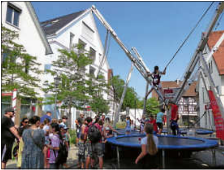
Das Riesen-Trampolin der Stadtwerke war wie immer ein Magnet für Jugendliche und Kinder wie auch das Kisten-Stapeln der Pfadfinder Royal Rangers. Ebenso gut besucht war auch der Stand des Bürgerausschusses des Bächtlefestes am Marktplatz.