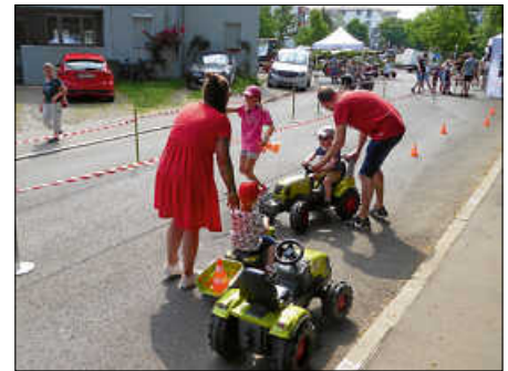
Neben einem Großflächenheuwender und weiteren landwirtschaftlichen Erntemaschinen gab's bei der Firma Claas einen Bobby-Car-Parcours für die Kleinen.