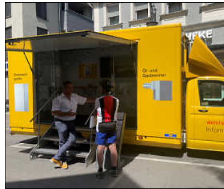
In der Energiestraße ging es bei der Firma Trunz um energiefreundliche Heizsysteme, beim Schülerforschungszentrum um die Umwandlung von Energien und bei der Firma Elektro Buck um nachhaltige Heiztechnik mit Infrarot-Steuerung.