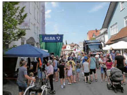
Ein großes Aufgebot an Großfahrzeugen, Mülleimer-Torwandschießen und viele Infos gab es bei der Firma ALBA.