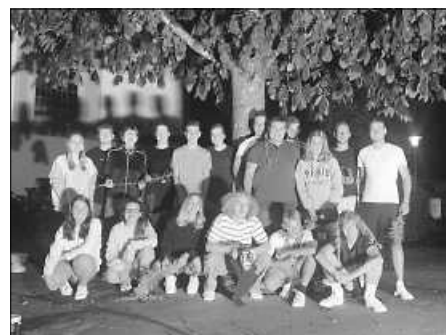
KLJB Landjugendgruppe Fulgenstadt