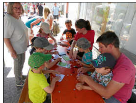
Beim städtischen Stand des Freiwilligen Ökologischen Jahres (FÖJ) wurde Upcycling großgeschrieben: Die Kinder bastelten Schmetterlinge aus Konzeptpapier.