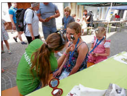
Neben dem Naturschutzzentrum Wilhelmshausen präsentierte sich auch das Naturschutzzentrum Wurzacher Ried. Hier gab's naturgetreue Schminke fürs Gesicht.