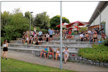
Die Fans feuerten die Mannschaften an.