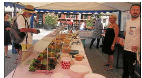
Neben der Bürgerwache, den Donaulerchen und anderen Vereinen sorgte der Türkische Elternbeirat für das leibliche Wohl. Für musikalische Unterhaltung sorgten die Musikvereine Friedberg und Inneringen.