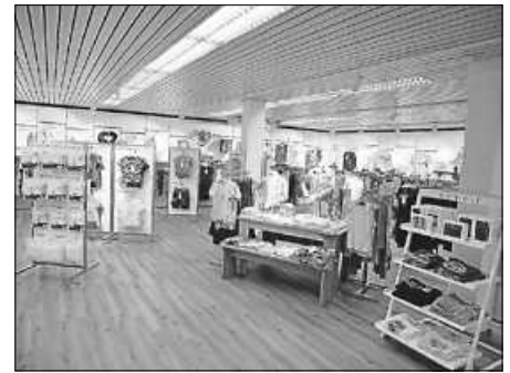
Der neue „Marco Family“ zeichnet sich unter anderem durch seine große Kinderabteilung aus.