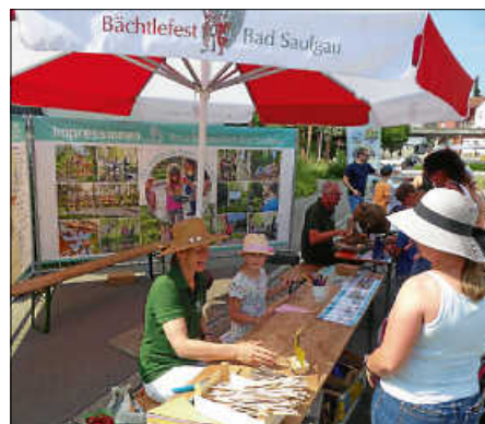
Sehr beliebt war auch der Stand der Tourist-Info mit Informationen zum Bad Saulgauer NaturThemenPark. Gegenüber präsentierte sich die Tourismusbetriebsgesellschaft mit der Sonnenhof-Therme und nahm die ausgefüllten Laufkarten der Kinder entgegen.