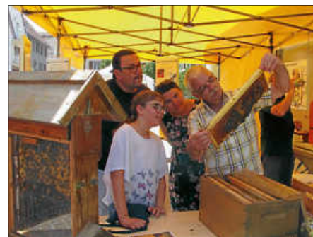
Der Imkerverein Herbertingen e.V. hatte ein zahmes Bienenvolk dabei und bastelte mit den Besuchern Bienenwachskerzen.