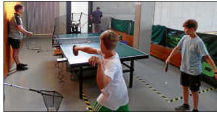
Außerdem wurde gegen Roboter Tischtennis gespielt.