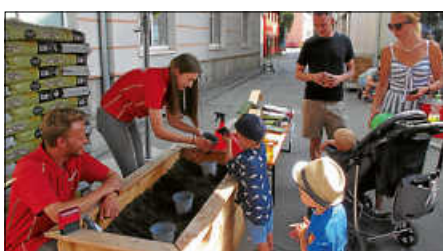
Über 300 Pflanzen wurden beim Stand des TOOM-Baumarktes umgetopft. Außerdem gab's für die Besucher viele hundert Eimer zum Mitnehmen.