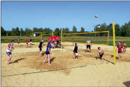
Beim Jugend-Sport- und Umwelttag drehte sich alles rund um das Beachvolleyball-Turnier.