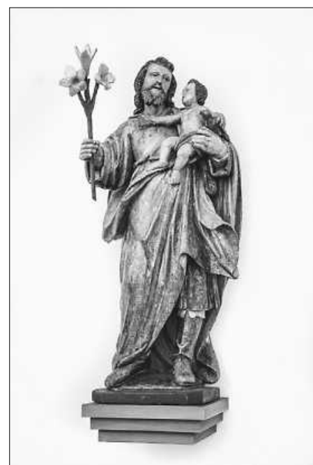
Heiliger Josef in der Antoniuskirche Bad Saulgau

Seelsorgeeinheit Sankt Johannes Baptist Bad Saulgau