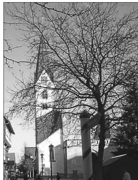
Kath. Kirchengemeinde Bad Saulgau

Seelsorgeeinheit Sankt Johannes Baptist Bad Saulgau